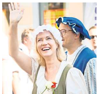
Ministerpräsidentin Manuela Schwesig kam als Bäuerin verkleidet.