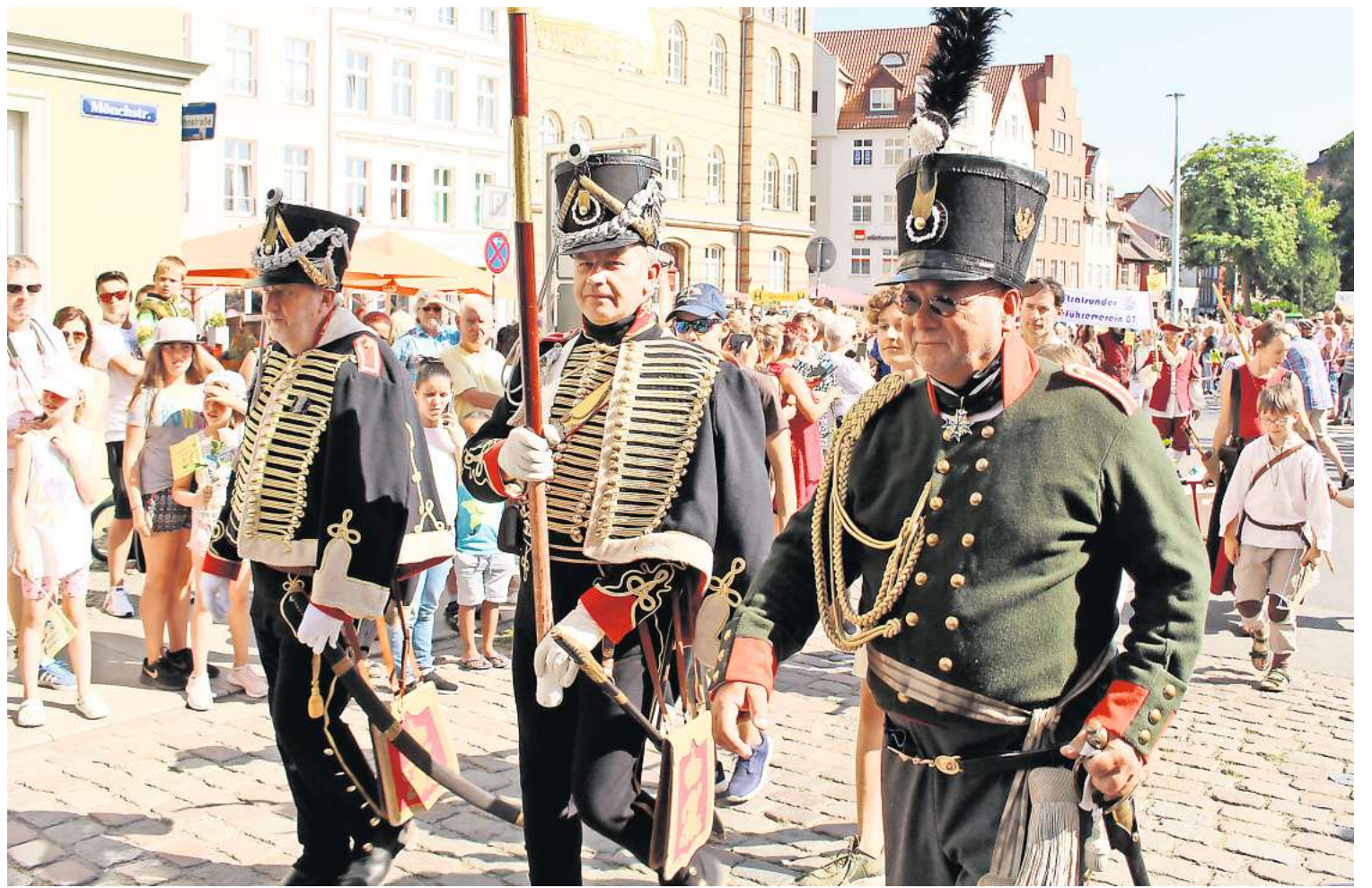
Rund 500 edel kostümierte Stralsunder zogen beim Festumzug durch die Stralsunder Innenstadt. Tausende Zuschauer säumten die Straßen.

Der Festumzug startet um 16 Uhr. Rund zehn Unternehmen und Vereine beteiligen sich mit eigenen Wagen. Die Strecke: vom Neuen Markt über den Alten Markt vorbei am Ozeaneum zur Hansa-Wiese. Ich